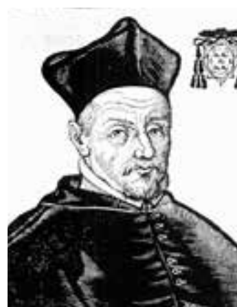
Fig. 2. Antonio Zapata y Cisneros, viceré di Napoli dal 1620 al 1622 (inc. del 1604, da Escartín, cit., p. 235).

lessandro l'edificato mostrava ancora un aspetto deforme e casuale, come i documenti recentemente ritrovati mostrano con evidenza 4 , avendo la cortina seguito per il primo tratto l'allineamento della strada Toledo, per poi piegare bruscamente verso il palazzo vicereale vecchio. Verso il palazzo vicereale nuovo, poi Palazzo Reale, solo la chiesa di S. Spirito di Palazzo, poi demolita, delimitava questo lato estremo della piazza, insieme ad un piccolo fabbricato d'abitazione.