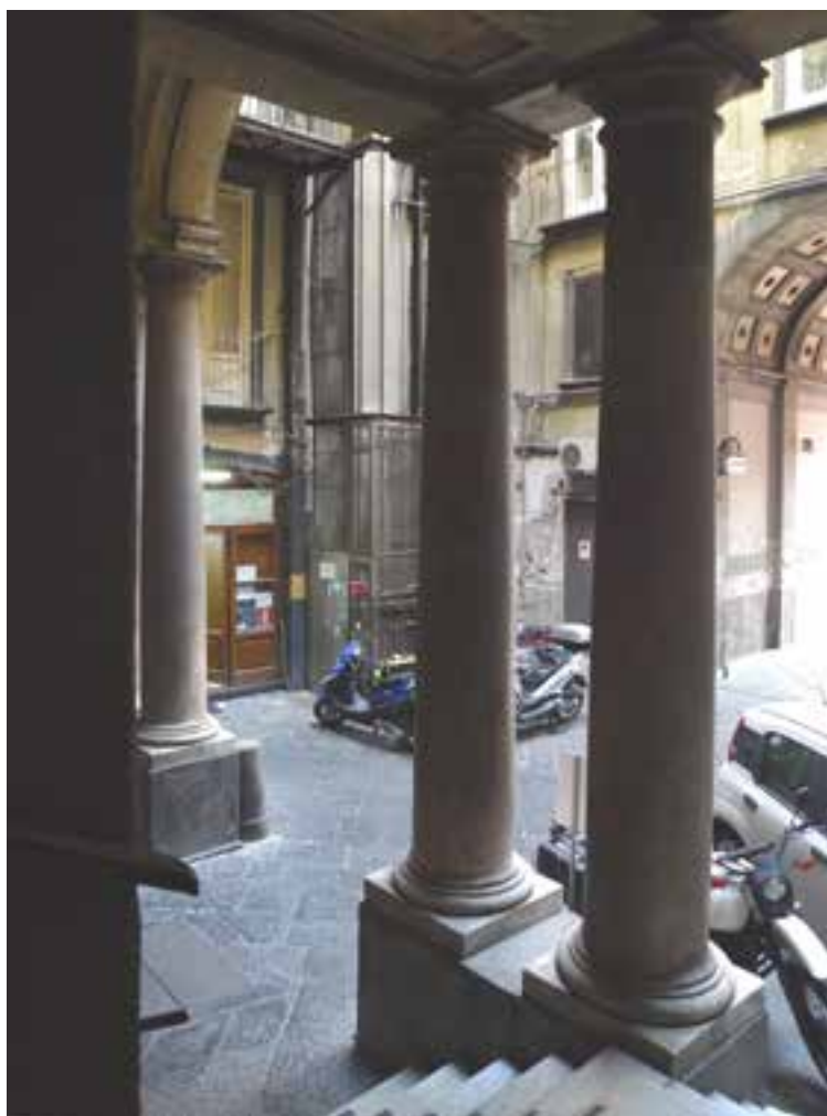
Fig. 12. Scorcio dell'invito della scala.

quote d'interpiano diverse, perciò verosimilmente realizzato precedentemente e da altri proprietari. Il fatto che nel dipinto la facciata appaia del tutto complanare deve interpretarsi come una 'correzione' del pittore, che infatti non dà alcun conto neppure della evidente curvatura del fabbricato su via Chiaia, riconoscibile anche nella pianta Carafa. Nel dipinto di Joli, dedicato ad una scena di Carnevale, con uno dei carri barocchi che si dirige proprio al centro, dopo avere percorso via Toledo, le due ali di fabbrica presenti nel dipinto ritratto dalle finestre del palazzo vicereale vecchio (demolito solo nel 1837) sono, a destra, un'estremità dello stesso palazzo vecchio e a sinistra un edificio che a quel tempo fiancheggiava la chiesa di S. Spirito di Palazzo, poi demoliti entrambi con la sistemazione della piazza del Real Palazzo, oggi piazza Plebiscito.