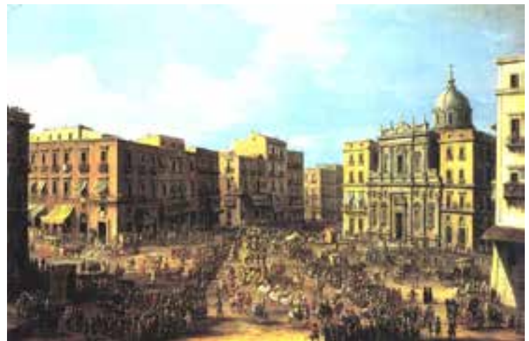
Fig. 7. Antonio Joli, Carnevale al Largo di Palazzo (1757). Collezione privata (da www.atlantedellarteitaliana.it ).