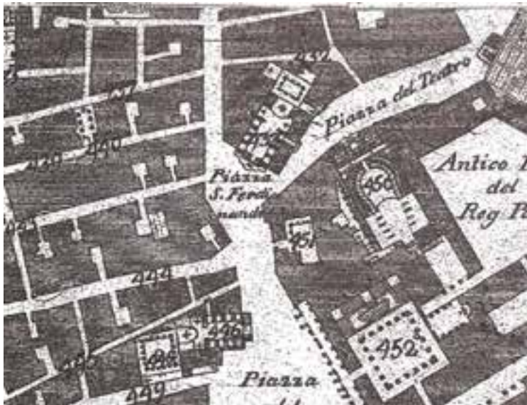
Fig. 3 - Pianta Carafa (1775). Particolare di piazza S. Ferdinando. Il palazzo Zapata ha ancora la configurazione antica, con un solo cortile accessibile da via Chiaia, di fronte all'ingresso del Palazzo Vecchio (451), mentre l'edificio su via Chiaia ha un ingresso autonomo.