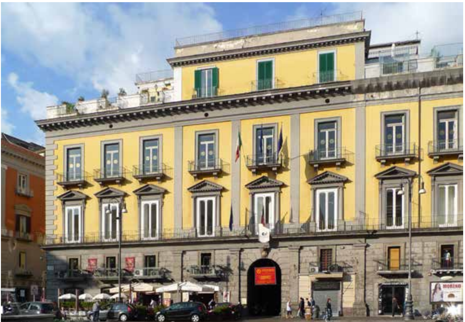
Figg. 16-17. Il palazzo Zapata in un rilievo moderno (da I. Ferraro, Atlante , cit. p. 328.); vista della facciata attuale.