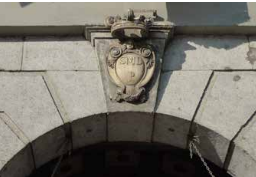
Fig. 10. Lo stemma dell'ospedale di Santa Maria del Popolo (SMDP).

ni, tra i quali lo stesso palazzo anche da lui riedificato. Tuttavia è singolare che la denominazione del palazzo non cambiò nel tempo, nonostante i tanti meriti del medico, mentre l'edificio attuale ricalca solo l'area di sedime, e non proprio, dell'originario palazzo di proprietà Zapata, e per giunta quell'attribuzione evoca una figura, quella del viceré, veramente esecrabile come uomo di chiesa ed individuo, ma ha avuto l'insolito onore di un perenne improprio ricordo, per quanto indiretto, solo per il meritevole lascito di un parente laico. E tuttavia, da ciò che apprendiamo dai cronisti, se anche la sede principale della residenza napoletana del viceré, o almeno la sua residenza ufficiale, continuò ad essere il palazzo reale, quando non l'arcivescovado, le difficili condizioni della sua amministrazione e lo scontento che essa provocò nel breve corso di due anni (1620-21) dovettero indurlo a muoversi poco e con circospezione nella città, e comunque sempre ben guardato dalla milizia tedesca che lo aveva accompagnato nel viaggio da Madrid a Napoli 11 . Sicché non è improbabile che egli possa aver deciso di entrare in possesso del fabbricato sul largo di Palazzo, per essere il più possibile vicino agli uffici di governo e non dover rischiare le aggressioni della plebe inferocita dalla carestia e dalle esazioni imposte dal governo spagnolo. Ciò spiegherebbe il passaggio della proprietà nel patrimonio familiare dei Zapata.