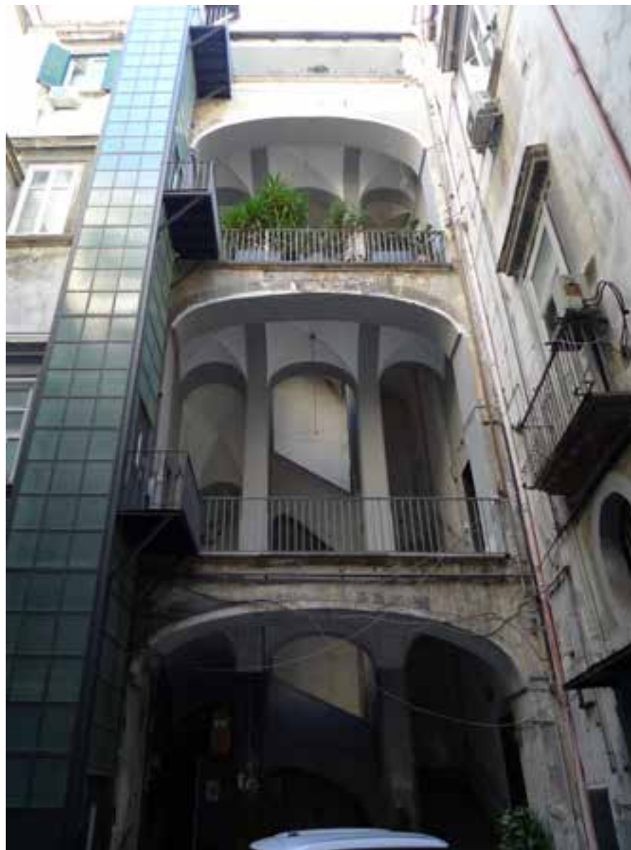
Figg. 8-9. La scala aperta del blocco su via Nardones; scorcio della struttura a volte rampanti.