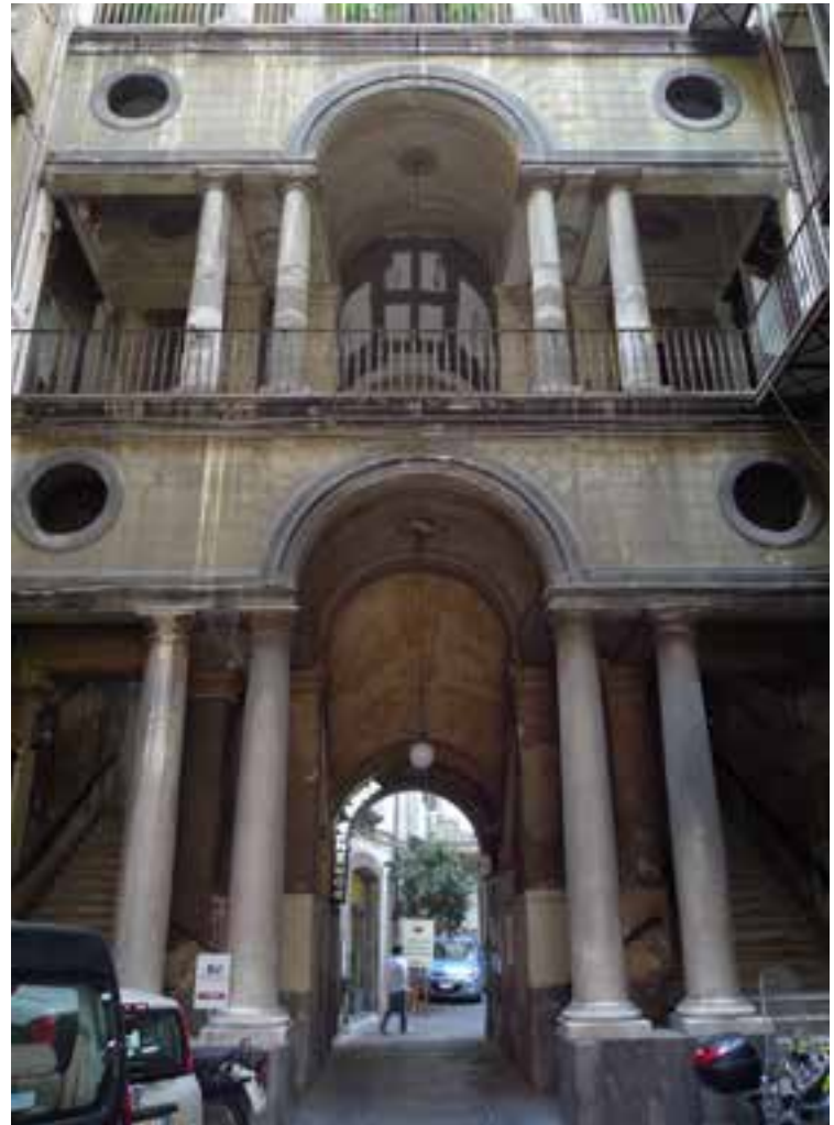
Fig. 15. Scorcio della scala aperta.

Nonostante questi limiti, evidentemente imposti da considerazioni economiche, l'edificio sviluppa una scala monumentale che impegna tutta la facciata interna, alla maniera delle tradizionali scale aperte napoletane del Settecento. Il tema strutturale di riferimento è quello della serliana, l'apertura a tre fornici che il trattatista Sebastiano Serlio promosse largamente alla