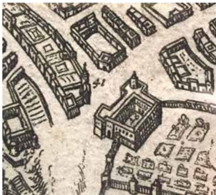
Fig. 1. Mappa Dupérac - Lafrery, 1566. Particolare del Largo di Palazzo, poi piazza S. Ferdinando. Si notano la chiesa di S. Spirito di Palazzo (41), poi demolita ed il palazzo Vecchio (48), con due torri angolari ed un campanile di segnalazione militare. L'insula del palazzo Zapata, in angolo con via Chiaia, è ancora un'area edificata perimetralmente, con un ampio spazio verde all'interno.

Ma il vasto largo interposto tra i due edifici, che sarebbe poi stato noto come il Largo di Palazzo, era ancora uno spazio architettonicamente poco definito: mancava la quinta della chiesa di San Francesco Saverio, poi S. Ferdinando, eretta grazie ad una donazione della viceregina Caterina de La Cerda y Sandoval (dopo il 1616) e soprattutto - per quanto già abitabile - non era completata la mole del palazzo vicereale nuovo, oggi noto come palazzo Reale, voluto dal marito viceré conte di Lemos e costruito dal 1602 in avanti col progetto di Domenico Fontana. Mentre sul lato che avrebbe ospitato il palazzo Zapata ed il palazzo d'A-