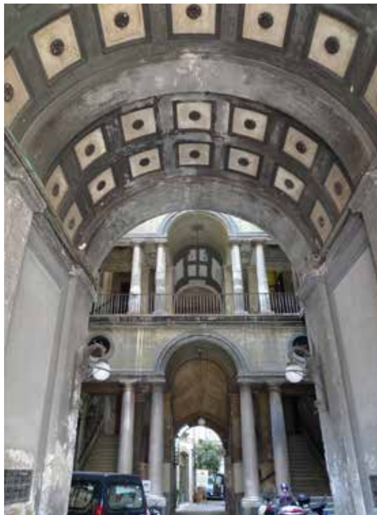
Fig. 11. L'androne e la scala, con il passaggio al secondo cortile.

Ma il palazzo edificato o acquistato dai Zapata in angolo con la via Chiaia è illustrato (fig. 7) in un dipinto di Antonio Joli 13 , dove esso compare secondo l'aspetto che aveva fino alla metà del Settecento (il dipinto è datato 1775) cioè prima dell'inter-