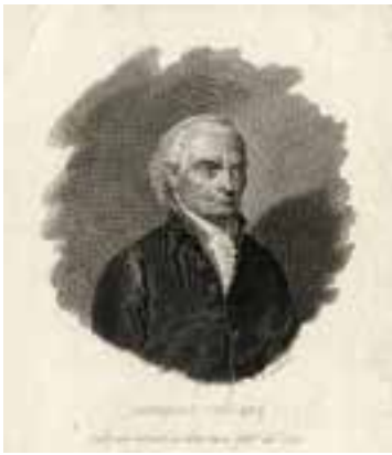
Fig. 6. - Ritratto di Domenico Cotugno (incisione di A. Locatelli, Biblioteca Nazionale di Napoli).

cembre uno spaventoso incendio appiccato al vicino palazzo D'Alessandro, in angolo con via Nardones - forse perché vi erano conservati atti processuali che riguardavano i giacobini, che proprio in quel mentre venivano trasferiti alle galere o alla forca, come ricorda il De Nicola 7 - si estese anche al palazzo vicino, danneggiandolo gravemente.