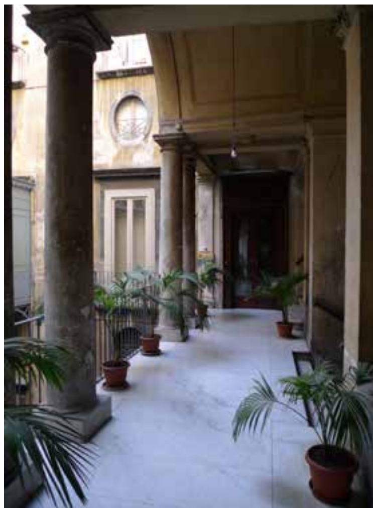
Fig. 13. Un ballatoio di piano.

La fortunata immagine pittorica, datata 1757, consente di verificare quale fosse la situazione dei luoghi fino alla metà del Settecento e quale sia stato l'intento di Carlo nel mettere mano alla ristrutturazione dell'edificio. In primo luogo egli adoterà un unico ingresso centrale dalla piazza, in modo da rivolgere l'intera composizione di facciata verso lo spazio che era venuto ormai