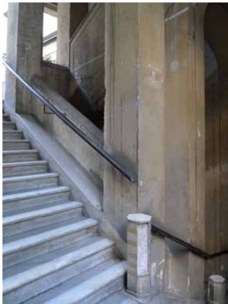
Figg. 18-19. Particolare degli spengnitorce ai piani e scorcio della rampa centrale con i supporti di oggetti ornamentali oggi scomparsi.

della tradizione locale. Dal fronte segnato a conci isodomi, aperta sul cortile sul quale si affacciavano i quattro locali delle rimesse, definiti da archi ribassati, la scala principale serve due grandi appartamenti per piano, secondo una tradizionale impostazione; accessi secondari ad appartamenti posti a quote intermedie sono aperti sui pianerottoli interni, relativi a cespiti destinati a locazione sin dall'origine, ovvero ad appartamenti servili. La distribuzione interna degli appartamenti maggiori è quella consueta - protrattasi per tutto l'Ottocento - che vedeva prevalere una sequenza di ambienti di rappresentanza in linea, generalmente poco e mal serviti da passaggi secondari, talvolta pensili, come in questo caso avviene al secondo piano, con un passaggio costruito nel Novecento per le esigenze del gioco d'azzardo 17 .