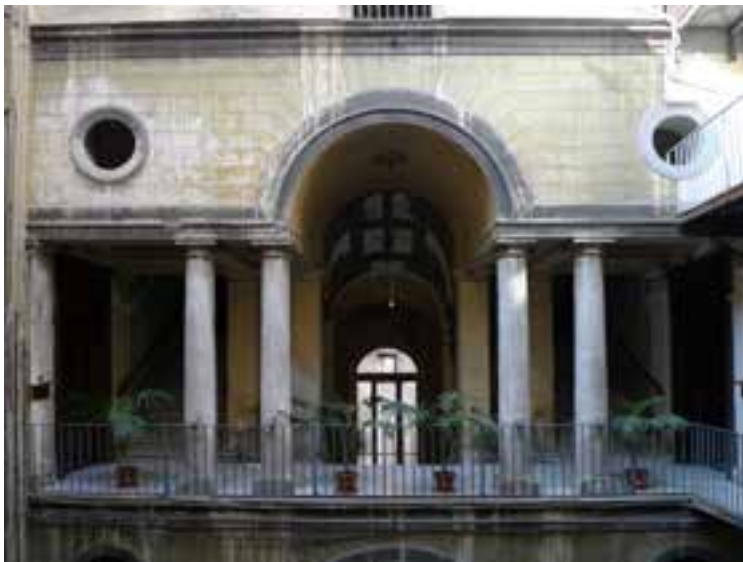
Fig. 14. Il ballatoio di servizio a serliana.

di un ordine gigante a semplici paraste, impostato su di un basamento listato, di ordine dorico. Al centro di essa si apre il nuovo portale d'ingresso, il cui stemma in chiave fu posto dalla città al tempo in cui il fabbricato fu acquisito dall'ospedale di S. Maria del Popolo (degli Incurabili, SMDP 14 ) in seguito alla soppressione dell'ospedale di S. Giacomo e Vittoria, originario destinatario della donazione ('confidenza', come viene ricordata) del regio consigliere duca di S. Mango Diego Zapata 15 .